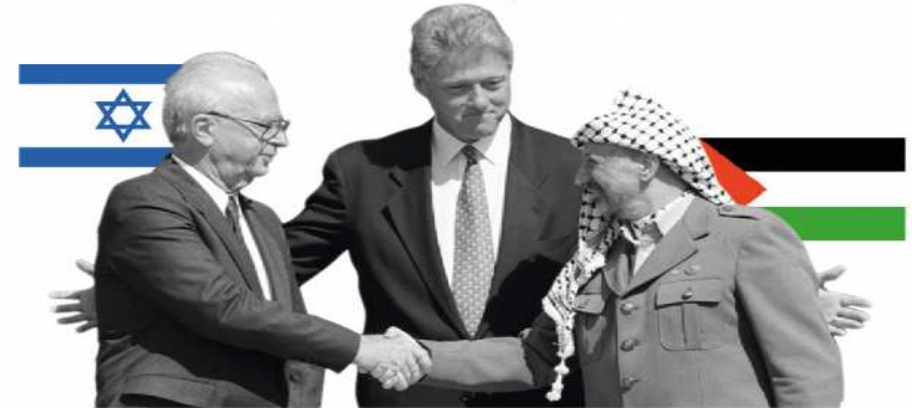
Yitzhak Rabin, Premier ministre israélien, Bill Clinton, Président des États-Unis et Yasser Arafat, Président du comité exécutif de l'OLP (Organisation de Libération de la Palestine)

Accords d'Oslo : 13 septembre 1993 à Washington. Objectif : poser les premiers jalons d'une résolution du conflit israélo-palestinien .