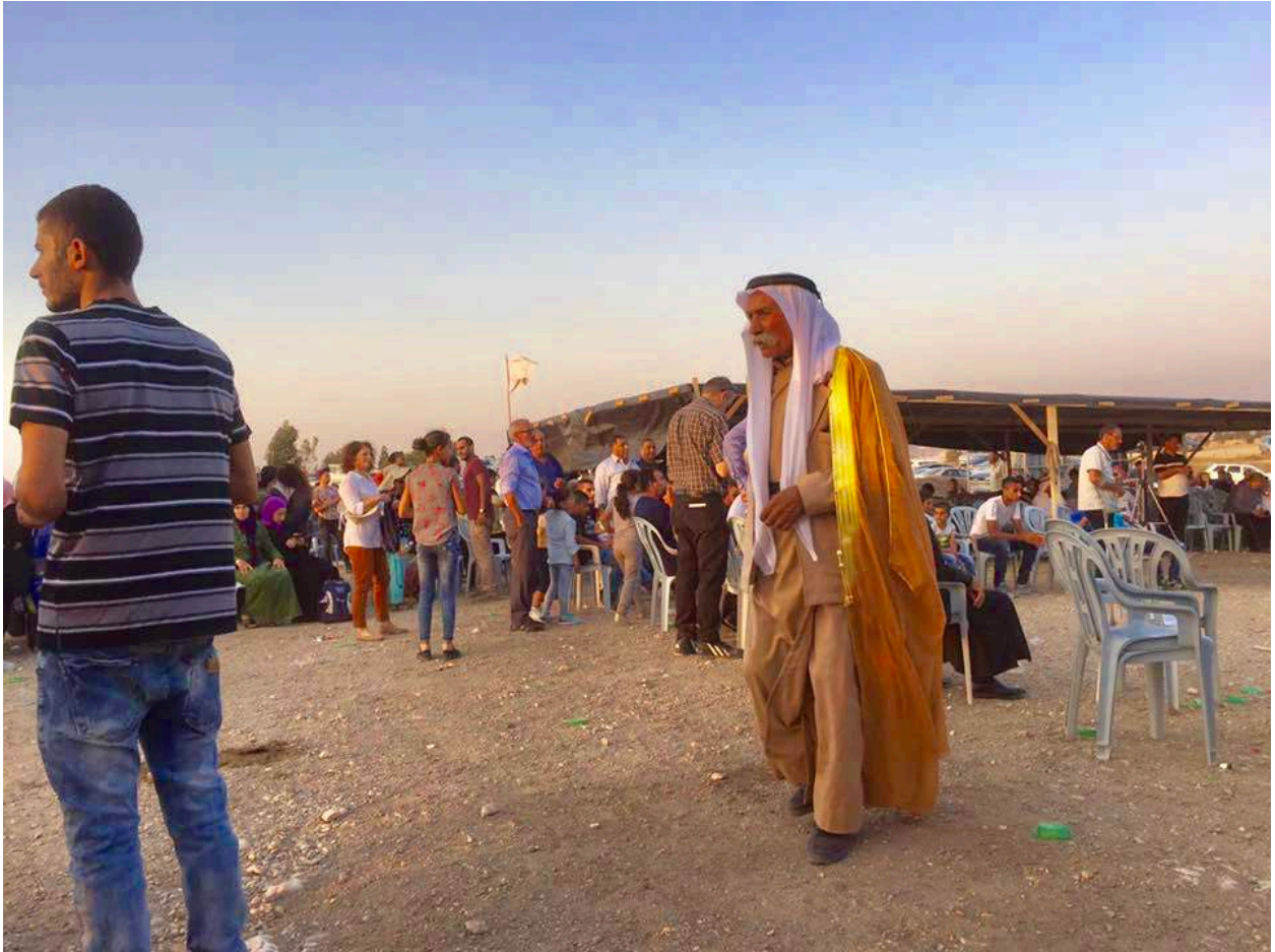
Al Araqib a été démoli pour le 117ème fois, le 23 août 2017