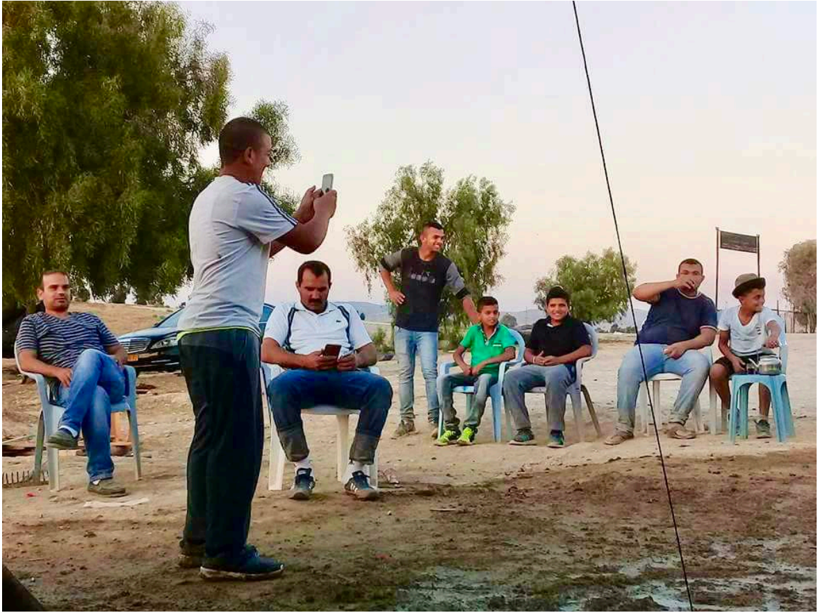
Le dimanche le 26 août, le rassemblement hebdomadaire au joint Lehavim Arrêtez Démolir Al Araqib