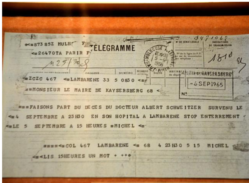
Le télégramme annonçant au maire de Kaysersberg le décès d'Albert Schweitzer.