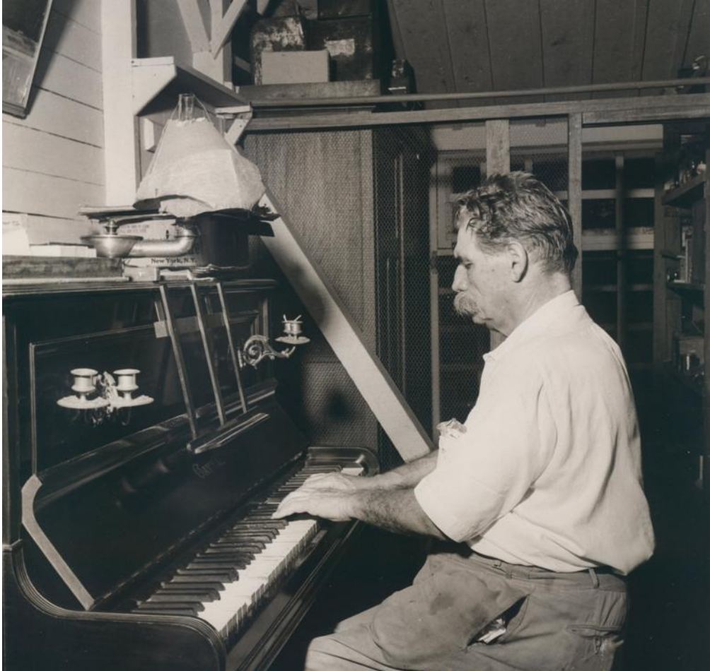
Albert Schweitzer dans sa case, à Lambaréné.

Un autre chemin vers Schweitzer serait la marche sur ses pas. À défaut des berges de l'Ogooué, où un hôpital moderne, héritier de son œuvre, porte son nom, à défaut d'Oslo, où, en novembre 1954, il vint chercher son prix Nobel de la Paix (millésimé 1952), c'est en Alsace qu'on peut croiser le polyphoni-