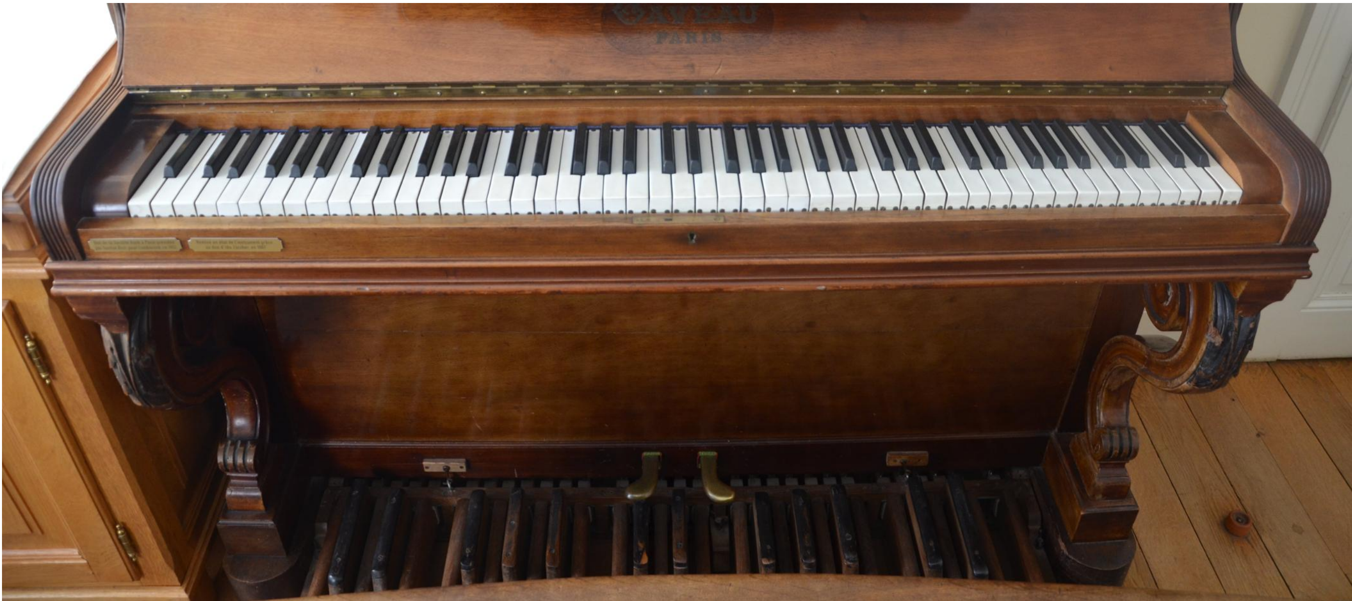
Au musée Albert-Schweitzer de Gunsbach, le piano-pédalier offert par la société Bach de Paris. La musique a, toute sa vie, soutenu Albert Schweitzer, ressourçant l'homme et finançant une partie de son œuvre.

Lire Schweitzer, lire sur Schweitzer, c'est rencontrer d'abord un penseur. Théologien d'abord. Pas de livre sur Jésus, aujourd'hui encore, qui ne puisse ignorer les travaux de Schweitzer. Dès 1906, il interrogeait les rapports entre le « Jésus de l'histoire » et le « Jésus de la foi ». Tandis que ses sermons, de Strasbourg ou de Lambaréné, démontrent que le pasteur voyait l'Évangile comme une belle exigence proposée à l'homme libre. Philosophe ensuite. Celui qui étudia à Berlin et Strasbourg, et rédigea sa thèse sur Emmanuel Kant,