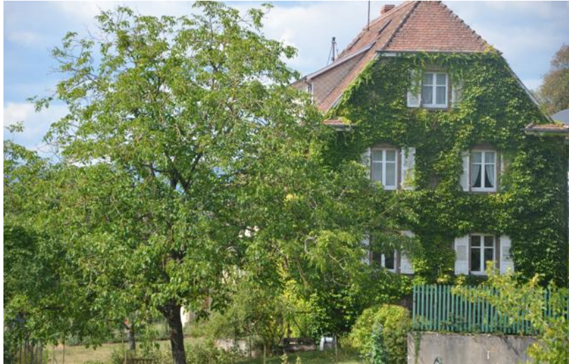
La maison d'Albert Schweitzer à Gunsbach, devenue un musée.

Cinquante ans après, Schweitzer demeure l'Alsacien le plus célèbre sur la planète. Son nom parle aux Allemands, aux Suisses, et même aux Japonais, plus parfois qu'aux Français et même aux Alsaciens. Le temps a passé, qui mélange aujourd'hui Tintin au Congo et Schweitzer au Gabon , et a été secoué aussi de polémiques : au fond, le « grand docteur blanc » n'aurait-il été qu'une autre facette du colonialisme, bonne conscience paternaliste et presque raciste, dans les mots sinon dans